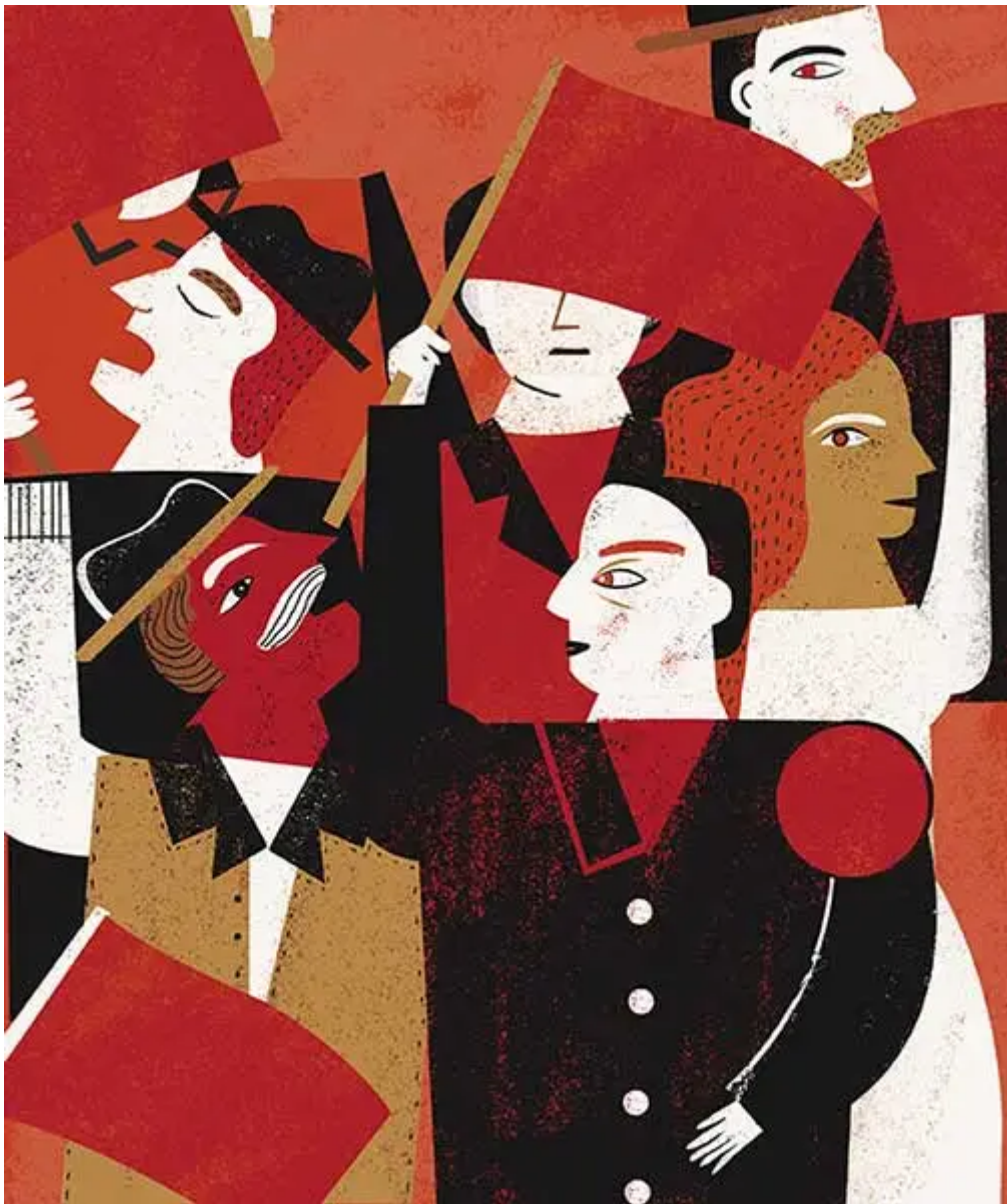
Ilustración: Estelí Meza

Con el objetivo de aportar un panorama global sobre los tipos de mando que se ejerce en las corporaciones de seguridad pública a nivel mundial, consideré pertinente llevar a cabo una revisión de estos esquemas en 200 países del mundo. Este análisis incluyó a los 193 estados miembros de la ONU, así como al Vaticano, Palestina, Taiwán, Hong Kong, Macao, Kosovo y Puerto Rico, ya que a pesar de que algunos de ellos no son soberanos, sí tienen administración independiente de su policía nacional.