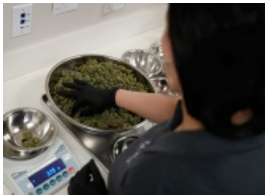
Propietaria de cerveza Corona venderá marihuana