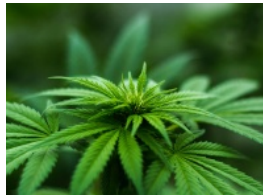
Venta de marihuana en Canadá se ampliará a negocios privados