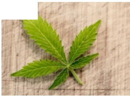
Sánchez: se planteará despenalizar drogas