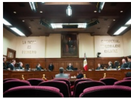
Corte rechaza despenalizar posesión simple de marihuana