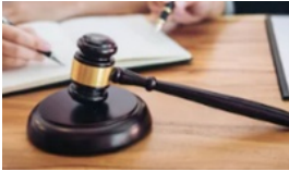
Congreso de CDMX, facultado para decidir uso de marihuana medicinal: SCJN