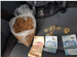
'Dealer' decía vender dulces, pero eran 'churros de marihuana'